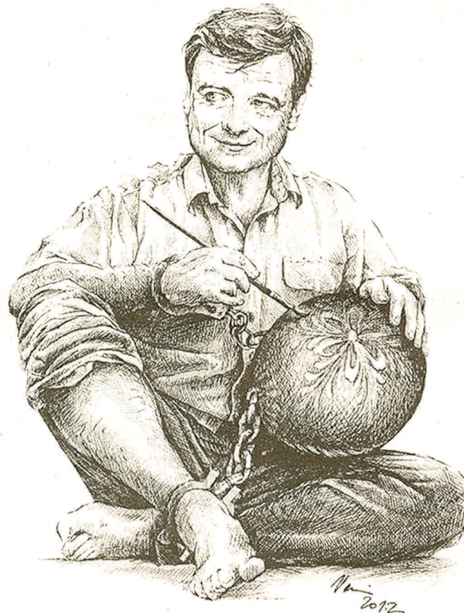
S velikonočními okovy Kreslíř z Moravských Budějovic vyobrazil i bývalého středočeského hejtmana Ratha v okovech.

Nakreslil jsem například období, kdy padala Nečasova vláda. Je tam